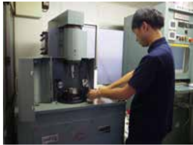
油剤性能を調査中

その答えを見出しにくいプロセスが販売に結び付くと言つてもいいだろうか。経験値がものを言う世界であり、それを「油で変わるものづくり」の実践そのもの。結果として「多品種・少量」を志向することになる。 「2カ月にドラム一本以上の要望があれば、オーダーメイド対応を採る。ニーズがある程度、まとまってくれば、製品として、具体化も可能になる。」 現場は様々な加工環境下に置かれる。ニーズを具体化するれば、自ずと多品種が構成されてこよう。