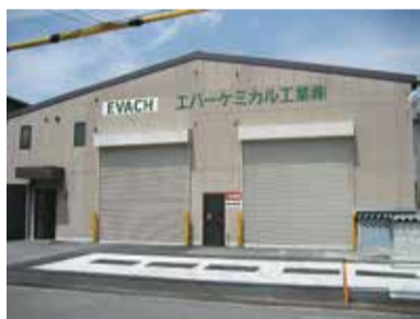
エバーケミカル工業第2工場

「加工油による」手荒れでの悩みを訴えられることもある。事実、「油剤のブレンド」次第でひりひり感がなくなり、労働改善に寄与するケースも、数多くある。作業の改善に繋がれば、効果その他にも影響し、トータルな生産性向上に期待が持てるようになる。 現場では、常に生産性向上が至上命令のように唱えられる。ものづくりの企業ならば当然だろう。 「しかしながら、生産