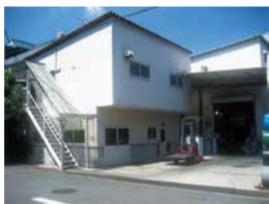
エバーケミカル工業本社工場

手荒れの悩み解消など作業改善にも寄与 「メカトロテック」出展など、機を見て、パブリックの展示会にも、参加してきた。来場者からは直接の加工のみならず、